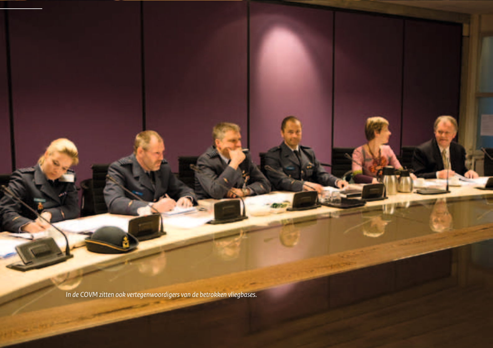
In de COVM zitten ook vertegenwoordigers van de betrokken vliegbases.