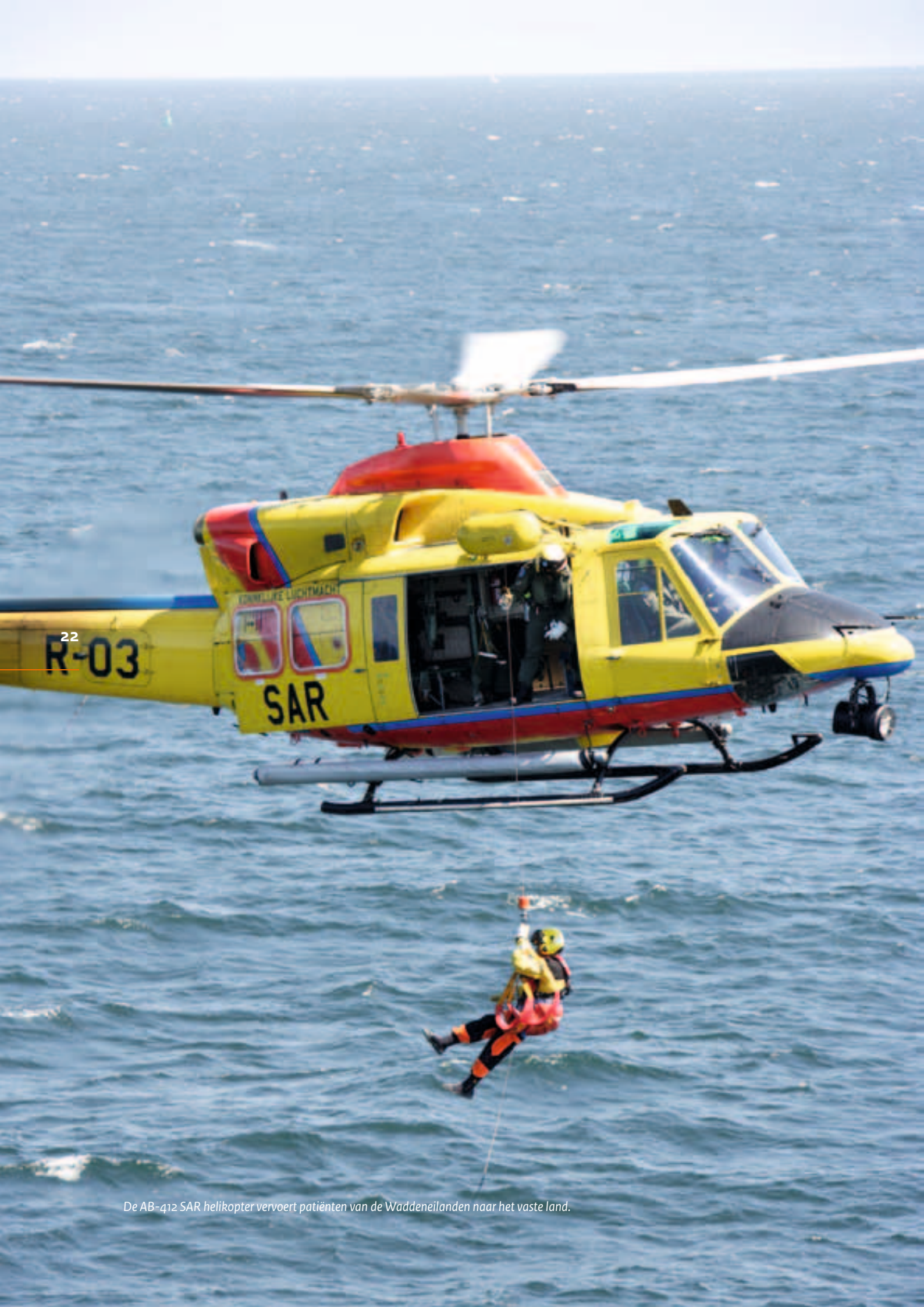
De AB-412 SAR helikopter vervoert patiënten van de Waddeneilanden naar het vaste land.