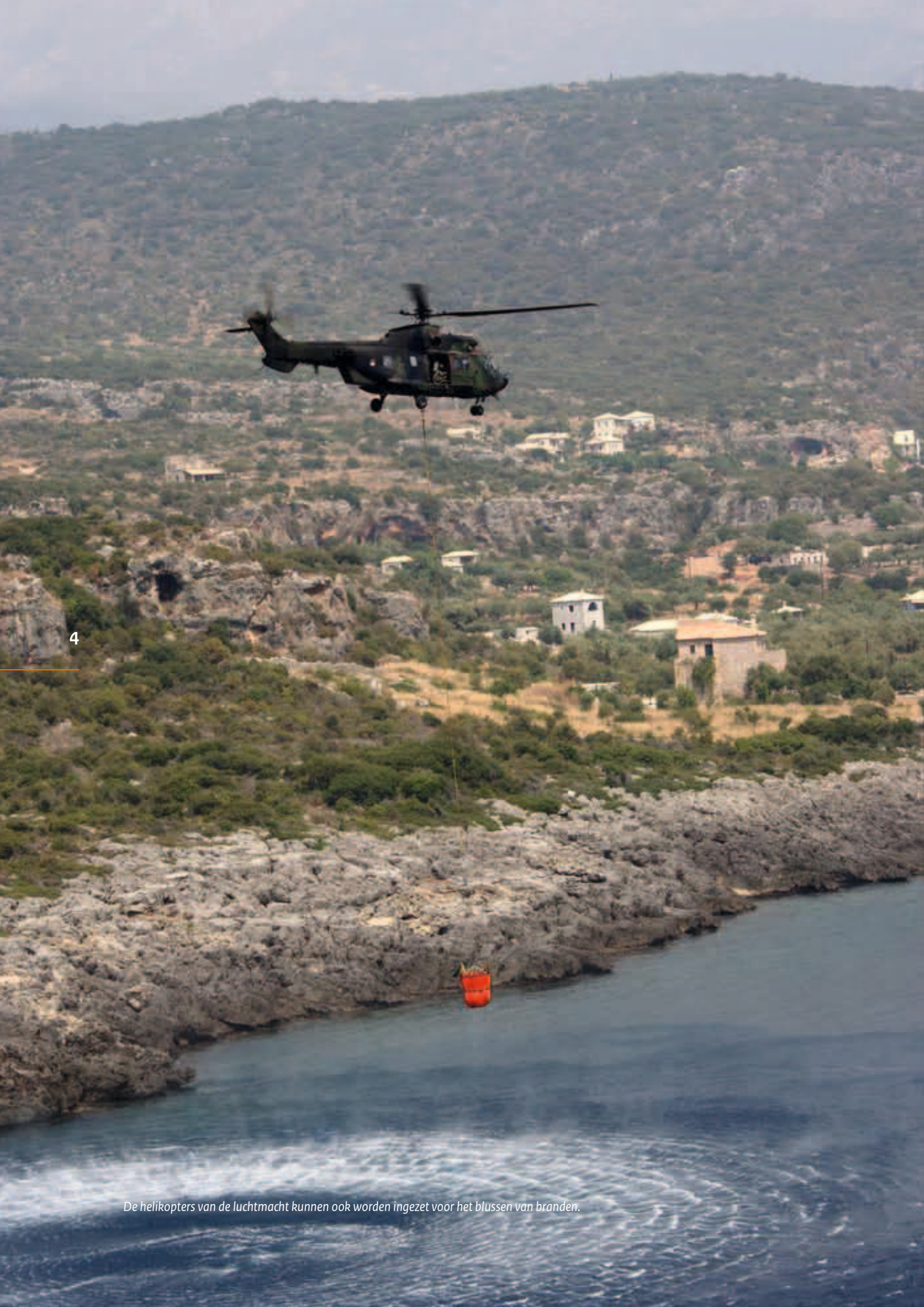
De helikopters van de luchtmacht kunnen ook worden ingezet voor het blussen van branden.