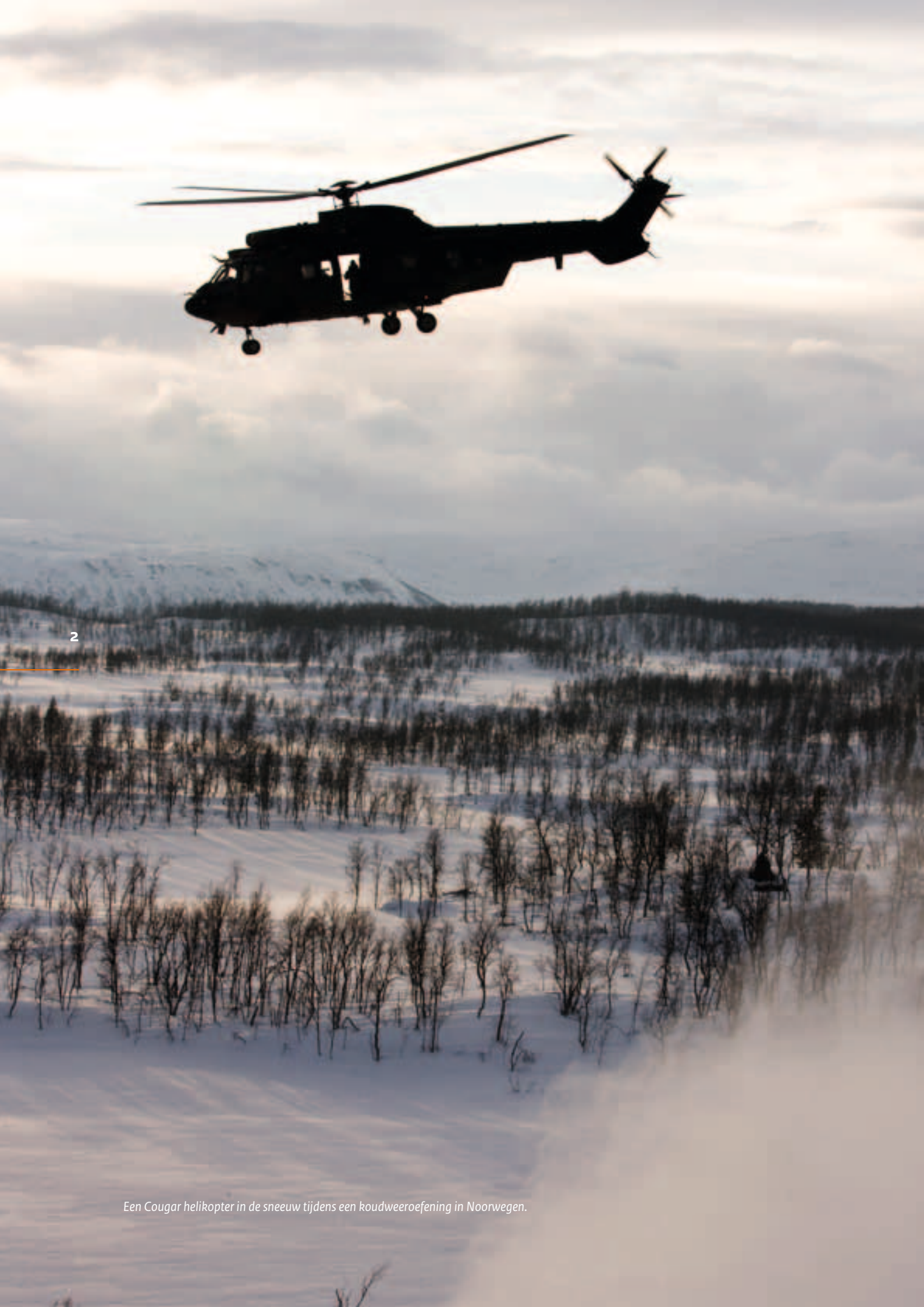
Een Cougar helikopter in de sneeuw tijdens een koudweeroefening in Noorwegen.