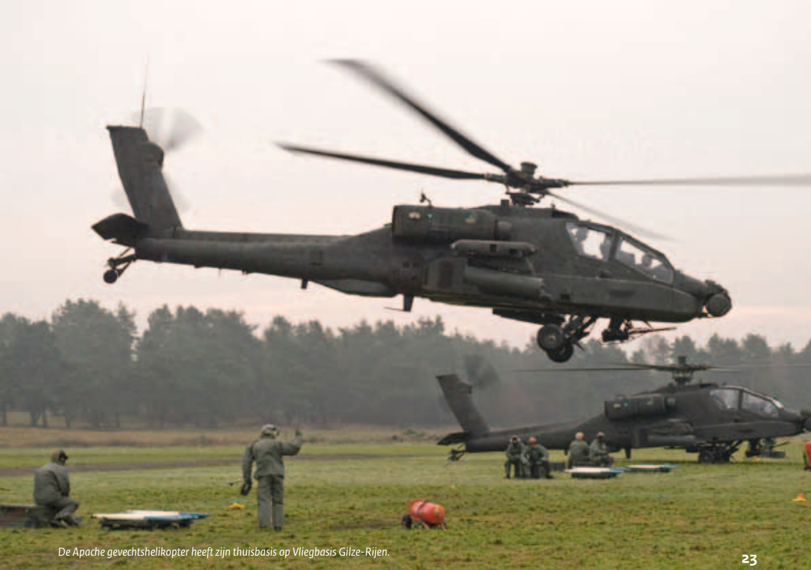
De Apache gevechtshelikopter heeft zijn thuisbasis op Vliegbasis Gilze-Rijen.