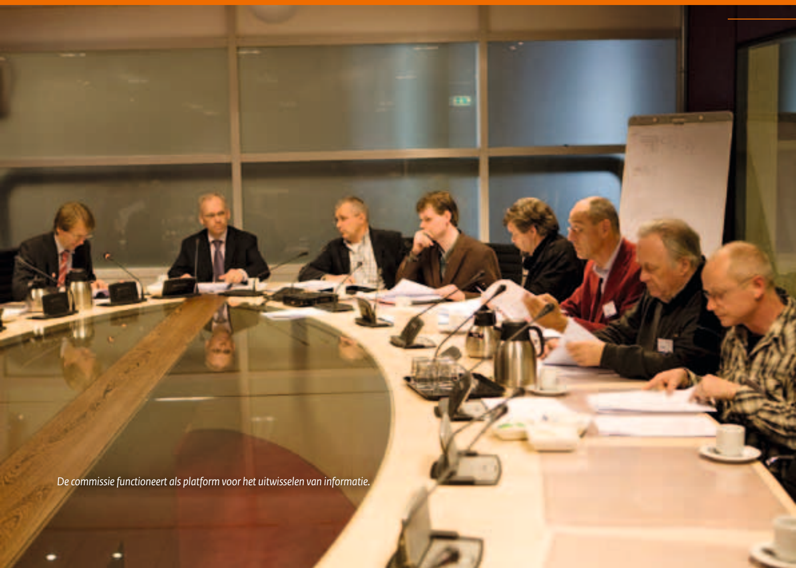
De commissie functioneert als platform voor het uitwisselen van informatie.