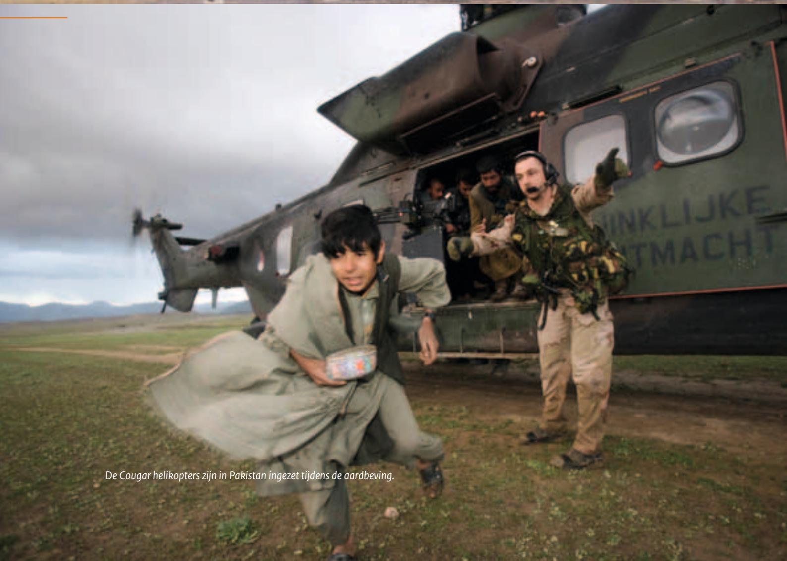
De Cougar helikopters zijn in Pakistan ingezet tijdens de aardbeving.