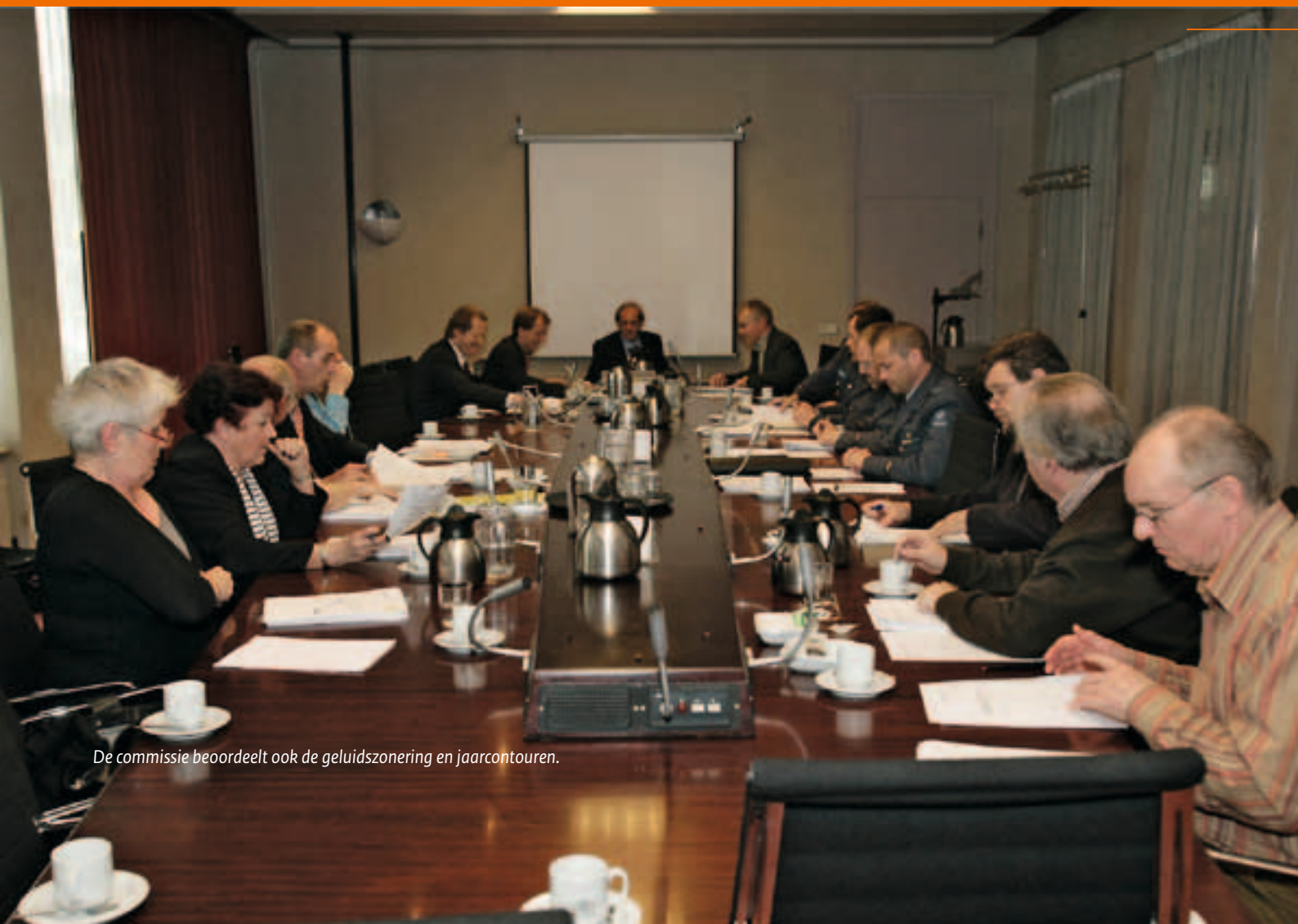
De commissie beoordeelt ook de geluidszonering en jaarcontouren.

Wilt u meer weten over bijvoorbeeld wet- en regelgeving, vliegprocedures of geluidzoneringsaspecten, dan kunt u informatie opvragen bij het secretariaat van de COVM van de betreffende vliegbasis of bij de gemeente waarin u woont. Uiteraard bestaat ook de mogelijkheid om contact op te nemen met vertegenwoordigers van uw gemeente in de COVM. Naam en adresgegevens staan per COVM vermeld in deze folder.