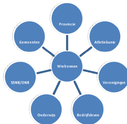
Figuur 2 Samenwerkingspartners

De sportbonden zijn hierin een onmisbare strategische en regisserende partner. De breedtesport is primair een gemeentelijke verantwoordelijkheid. De ondersteunende organisaties zoals Sportservice Noord-Brabant en het Olympisch Netwerk Brabant, het onderwijs en het bedrijfsleven hebben ieder hun eigen rol en dragen allen hun steentje bij. De Provincie Noord-Brabant neemt haar verantwoordelijkheid met name in de regio-overstijgende aspecten van de wielersport, te weten de gehandicaptensport, de topsport/talentontwikkeling, topsportaccommodaties en topevenementen. Het volgende hoofdstuk zoomt in op deze vier sporen, binnen de wielersport.