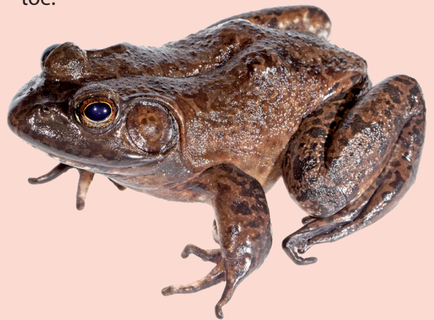
Amerikaanse stierkikkers: groot trommelvlies, geen ruglijsten en geen groene rugstreep

Voeg, als het kan, een foto of geluidsopname toe.