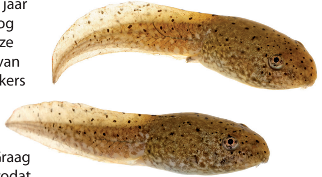
Larven Amerikaanse stierkikker met duidelijke stipjes

Niet alle kikkers die een hard geluid maken zijn stierkikkers. Graag een foto en/of geluidsopname maken van de kikker(vissen), zodat de waarneming door deskundigen kan worden bevestigd.