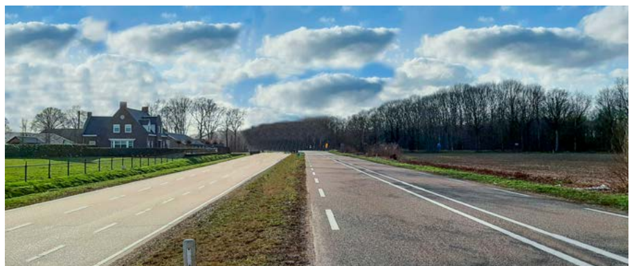
Aanleg parallelweg langs de bestaande N264 tussen rotonde Oudedijk en rotonde N277 (Peelweg)