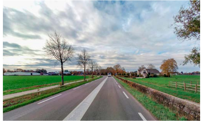
Impressie van de verkeersmaatregelen in de Pastoor Jacobsstraat, deelgebied 3b buiten de kom van Sint Hubert: geleiderail, verhoogde overrijdbare rijbaanscheiding en adviessnelheid van 60 km/uur