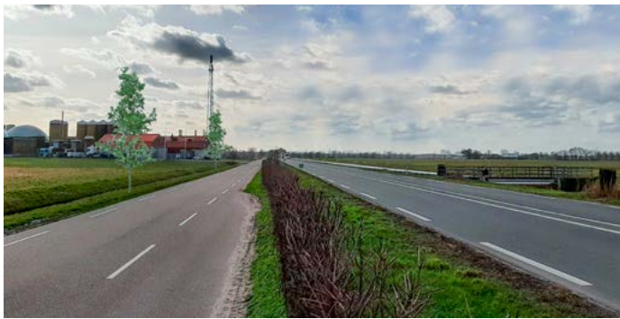
Aanplant nieuwe bomen in de Volkseweg langs de parallelweg (buitenberm)