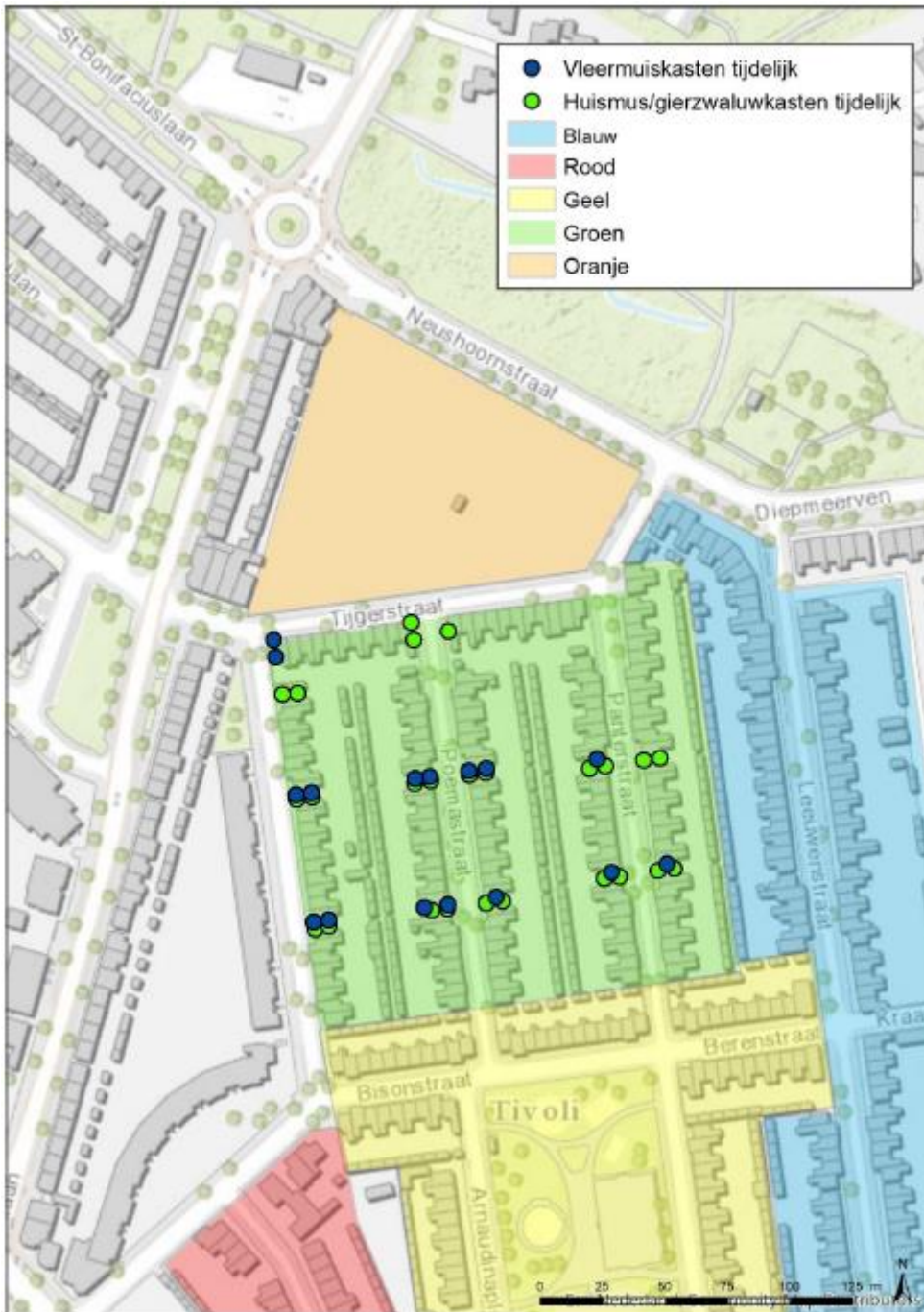
Figuur 2. Locatie tijdelijke voorzieningen. Huismus/Gierzwaluw: 25 tijdelijke voorzieningen Type Vivara Pro NK GZ 08, Gewone dwergvleermuis 16 tijdelijke kasten (type Vivara Pro VK MP 01).