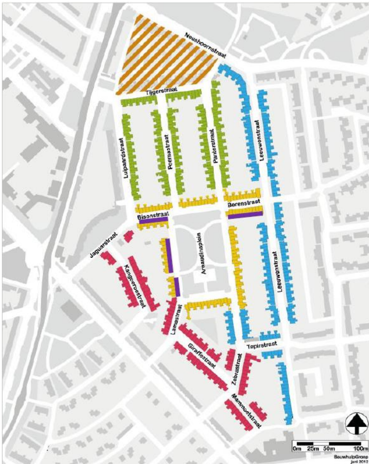
Figuur 3. Locatie permanente voorzieningen huismus, 20 permante nestplaatsen (geïntegreerde nestplaatsen onder dak door bijvoorbeeld vogelschroot twee pannenrijen op te schuiven zodat onder de eerste en tweede pannenrij potentiële nestplaatsen ontstaan).