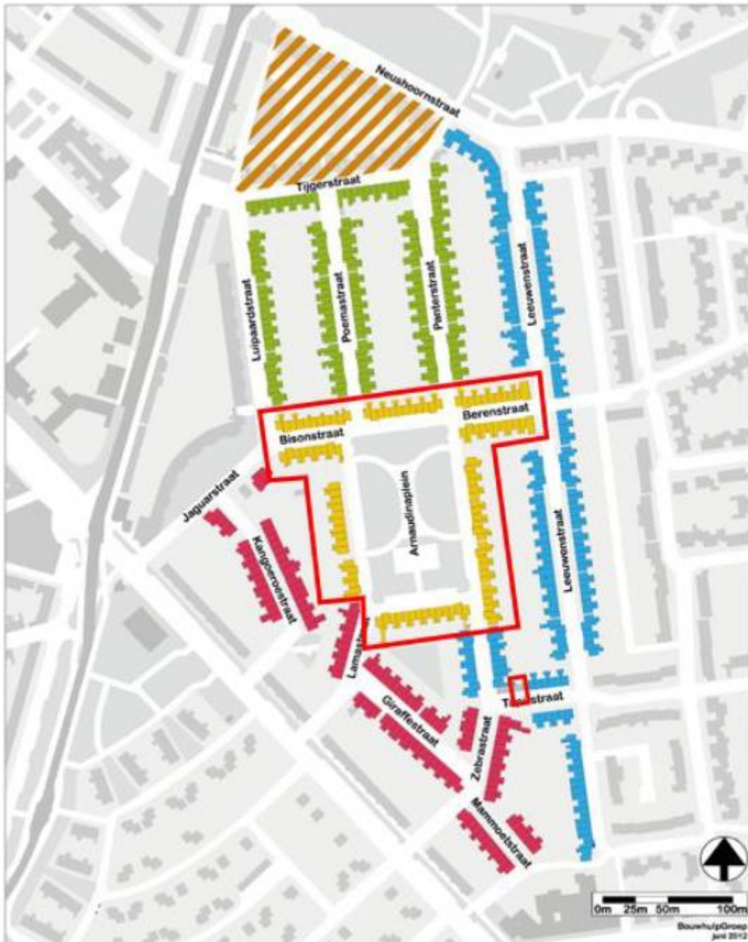
Figuur 1. Locatie deelgebied Geel in de wijk Tivoli te Eindhoven. De activiteiten vinden plaats binnen het rood omliggende gebied.