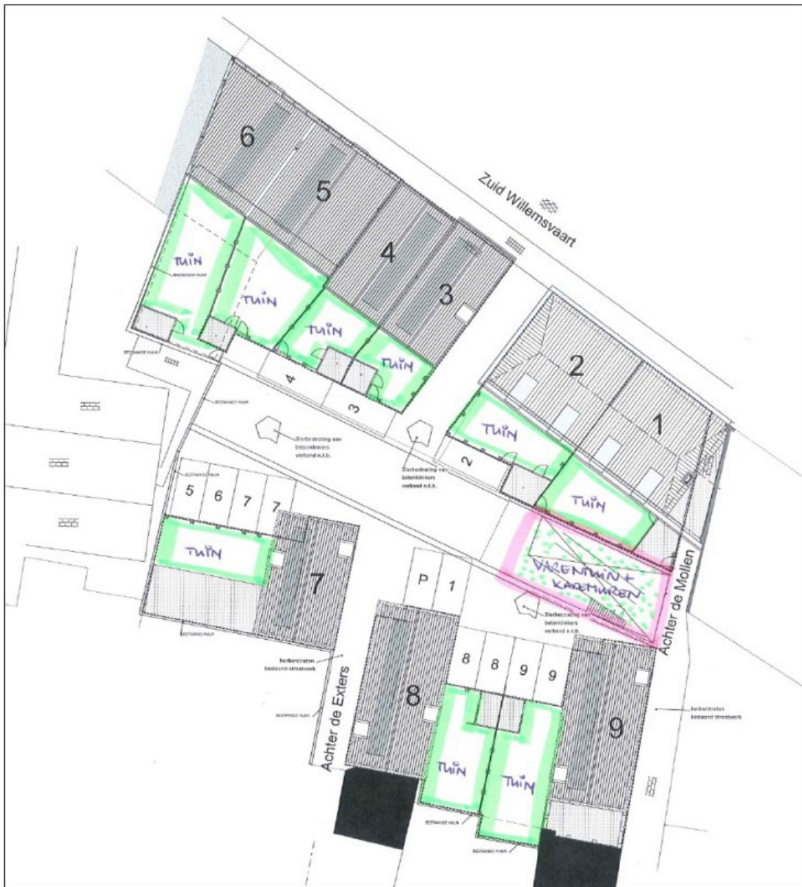
Figuur 5. Groene zones na planontwikkeling.