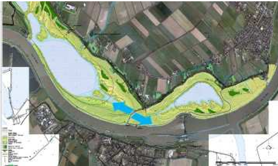
Figuur 3. Vergroting van instroomopening tussen de Maas en de zandwinplas 'Over de Maas'; dit kan alleen als er een langere brug over de instroomopening komt.