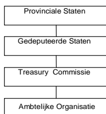
Figuur 3 De functionele organisatie

Om de treasury functie goed te kunnen uitvoeren is het van belang dat de treasury doelstellingen breed gedragen worden binnen de gehele organisatie, goed en adequaat wordt aangestuurd en dat er een goed functionerende treasury informatievoorziening aanwezig is.