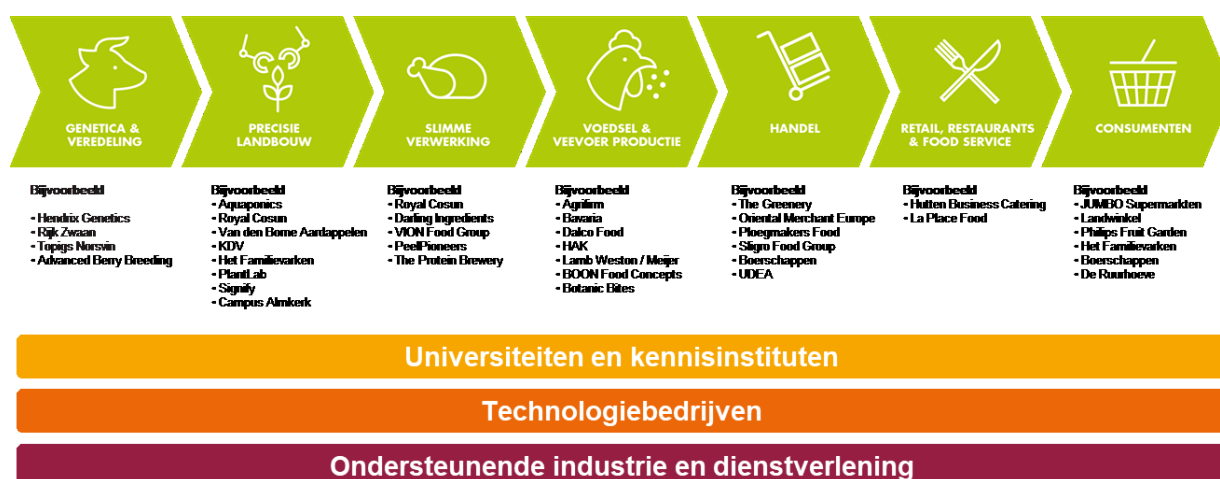
Figuur 1 - Het ondersteunende ecosysteem voor de Brabantse landbouw- en voedselketen

Waar het totale landbouw- en voedselcomplex in Brabant economisch sterk en robuust is, wordt de primaire sector in rap tempo kleiner, zowel in aantallen bedrijven als in arbeidsplaatsen. De productiecapaciteit neemt echter niet af als gevolg van schaalvergroting. Deze strategie van schaalvergroting om bij krimpemde marges het inkomen in stand te houden, stelt vooral de middelgrote (gezins-)bedrijven voor grote uitdagingen. Dit heeft geleid tot intensief gebruik van de grond en tot niet- grondgebonden productie met effecten voor de leefomgeving.