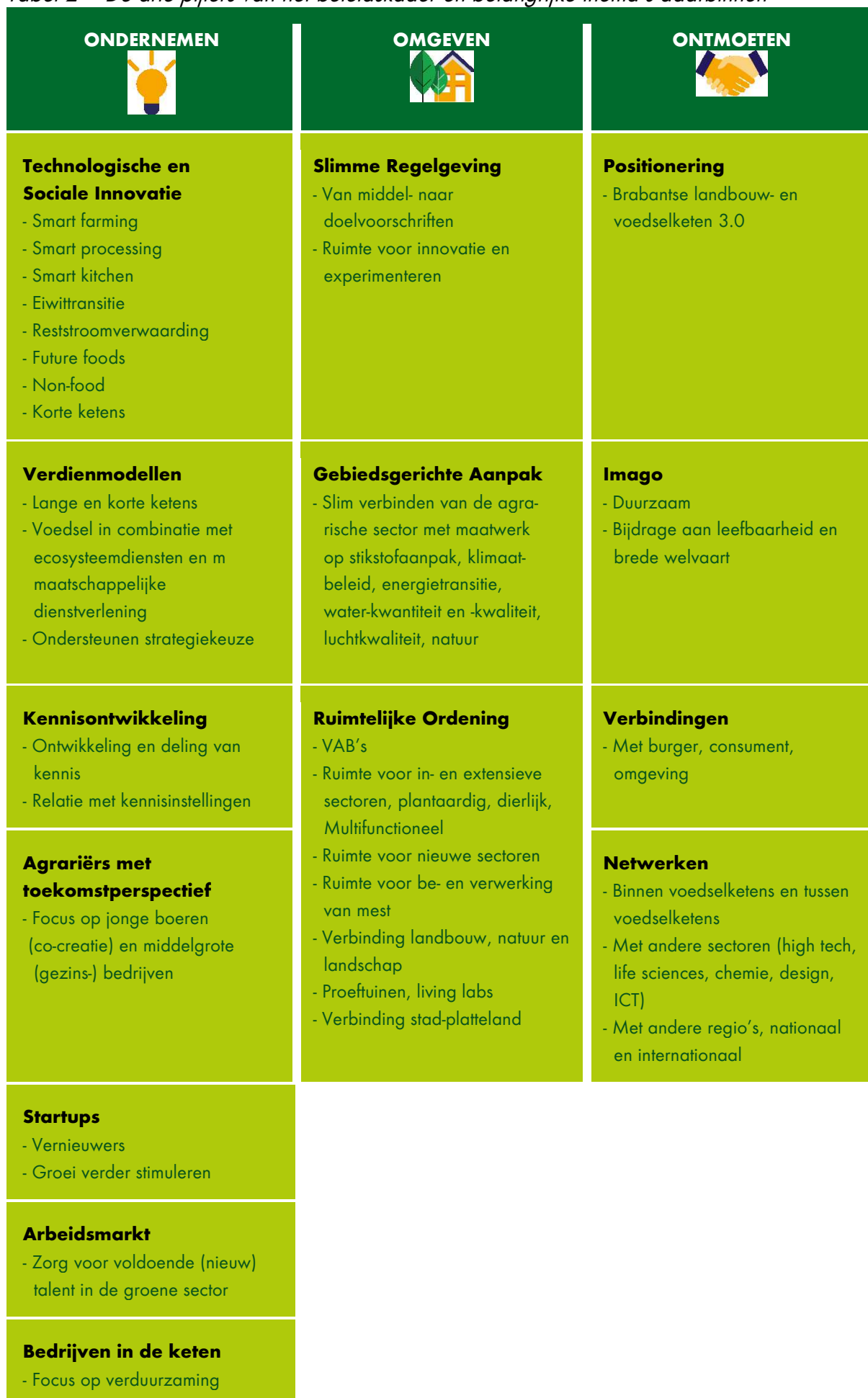
Tabel 2 – De drie pijlers van het beleidskader en belangrijke thema's daarbinnen