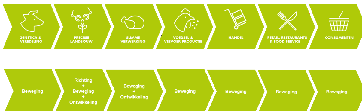
Figuur 2 – Rollen van de provincie