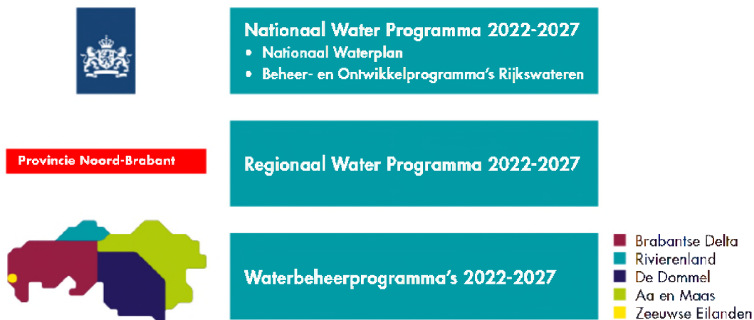
Figuur 1 Planstelsel waterbeleid