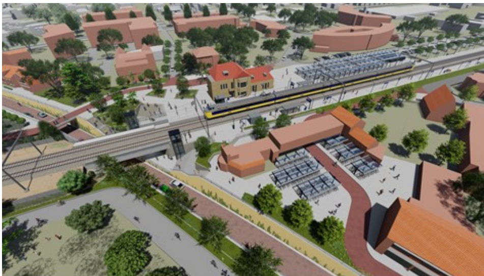
Impressie nieuwe situatie station Rijen vanaf zuidzijde.

Dit project sluit tevens aan op de snelfietsroute Breda - Tilburg, die eveneens in samenwerking met o.a. de gemeente Gilze en Rijen tot stand komt.