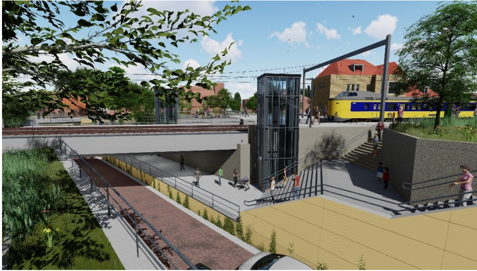
Impressies stijgpunten perrons station Gilze-Rijen, vanaf zuidzijde (Sporzone Gilze-Rijen)