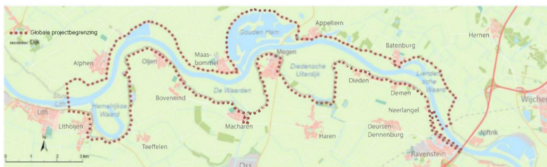
Figuur 1 Plangebied Meanderende Maas

In hoofdstuk 2 licht de Commissie de aandachtspunten voor het vervolgtraject toe.