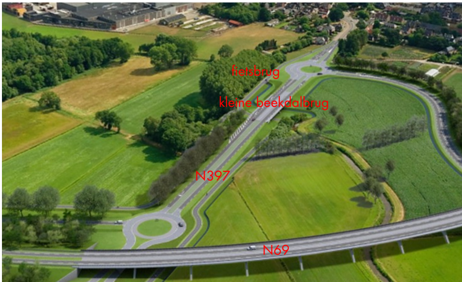
Afbeelding 3. Situatie 'kans' waarbij fietsonderdoorgang is geïntegreerd met onderdoorgang Keersop en gelijkvloerse oversteek is vervallen