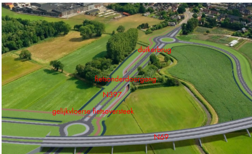
Afbeelding 2. Situatie referentieontwerp met gelijkvloerse fietsoversteek, aparte fietsonderdoorgang en duikerbrug

Het PIP N69 is opgesteld op basis van een referentieontwerp. Onderdeel van het contract tussen provincie en marktpartij die de N69 aanlegt is dat deze 'kansen' kan inbrengen; kortom optimalisaties op het referentieontwerp van de weg uit het PIP N69 die aantoonbaar meerwaarde bieden op de projectdoelstellingen en binnen het gestelde plafondbudget blijven. De door marktpartij aangeboden aanleg van de kleine beekdalbrug is een goed voorbeeld van zo'n 'kans', door de meerwaarde die deze biedt op onder meer de verkeersveiligheid, recreatie, natuur en financiën. In het referentieontwerp van de N69 wordt ter plaatse van de kruising N397 met de beekloop van de Keersop de huidige brug met duikerconstructie gesloopt en opnieuw aangebracht. Daarnaast bestaat het referentieontwerp uit een separate fietsonderdoorgang in de N397 en een gelijkvloerse fietsoversteek ter hoogte van de nieuwe aansluiting met de N69. Onderstaande afbeelding 2 geeft het referentieontwerp van de weg uit het PIP N69 weer.