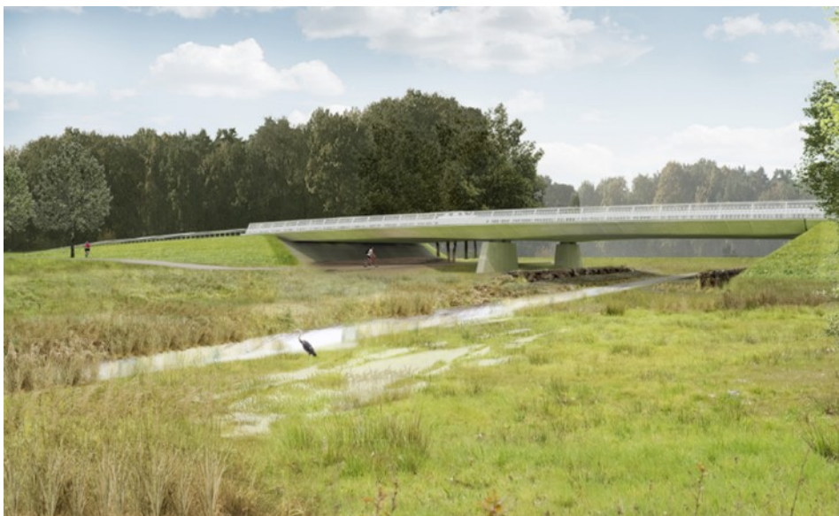
Afbeelding 4. Impressie van de nieuwe oplossing die met deze 'kans' wordt geboden