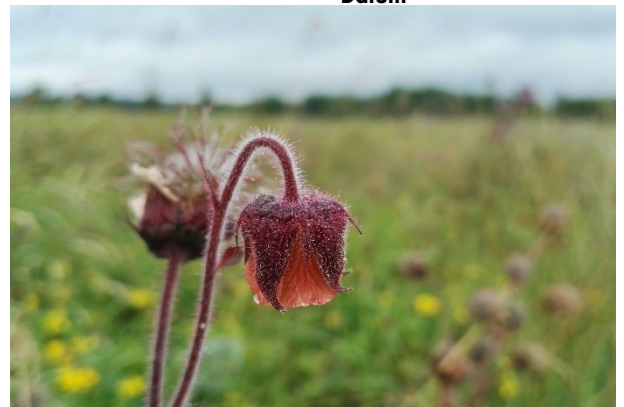
Figuur 7 Knikkend nagelkruid is zeldzame parel van natuurbos (Fabian Meyer)

Voor het bereiken van de doelen voor bos in Noord-Brabant zijn vervolgstappen nodig. De aanleg van nieuw bos heeft een looptijd tot 2030 en de revitalisering van de bestaande bossen loopt tot 2050. Met onze aanpak wordt een eerste start gemaakt. In 2020 wordt gekeken in hoeverre instrumenten uit de Wet natuurbescherming met betrekking tot onze provinciale wettelijke bevoegdheden en VTH-taken ingezet kunnen worden om de uitvoeringskansen van de bossenstrategie te versterken. Het resultaat hiervan zal in 2020 landen in een wijziging van de Beleidsregel natuurbescherming en de in 2020 vast te stellen Omgevingsverordening.