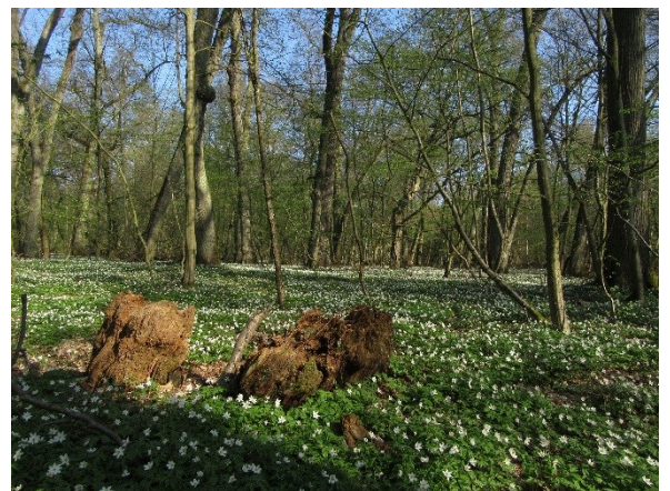
Figuur 2 Rijk loofbos met bosanemoon (Wiel Poelmans)