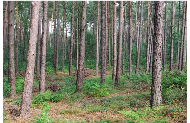
Figuur 1 monotone Grove dennenbos (Jan den Ouden)

Lange tijd waren ze vooral van belang voor houtproductie, recreatie en biodiversiteit; nu komen er functies bij als opvang CO 2 , herstel bodem- en waterkwaliteit en meervoudig gebruik voor recreatie en woon- en werklocaties. Er komen nieuwe bosvormen op als voedselbos, agroforestry, klimaatbos, oerbos en parkachtige zones in stedelijk gebied. Boskap - tot voor 10 jaar geleden stilzwijgend geaccepteerd - staat maatschappelijk onder grote druk. Zelfs het kappen van bos in Natura2000-gebied voor herstel van heide en hoogveen, roept weerstand op. Aan de andere kant duiken er steeds meer initiatieven op om bomen in te zetten voor klimaatopvang, hittestress in steden en hout als duurzame grondstof. We hebben in Brabant prachtige bossen maar overal staat de gezondheidssituatie onder druk.