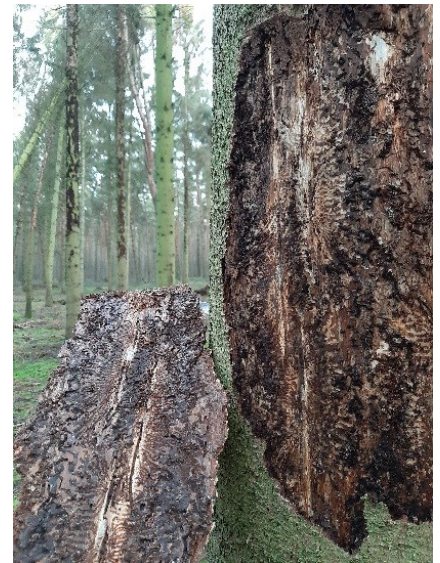
Figuur 5 Verwoestend vraatpatroon van letterzetter op fijnspar

Rijk: Rijk en provincies werken momenteel aan een gezamenlijke bosstrategie. Het rijk heeft hiervoor € 51 miljoen beschikbaar gesteld. Hiervan hopen wij tenminste € 10 mln naar Brabant te halen. Daarnaast is landelijk € 100 miljoen beschikbaar voor Natura 2000-gebieden waarvan een deel bestemd is voor bosaanpak en boscompensatie. Het rijk komt nog met middelen voor klimaatadaptatie.