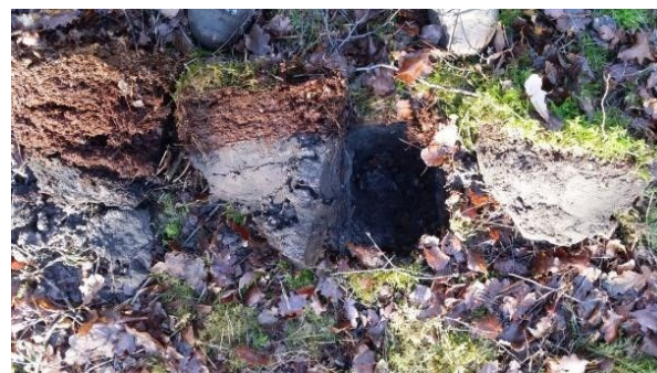
Figuur 3 Onverteerde strooisellaag (Bart Nyssen)