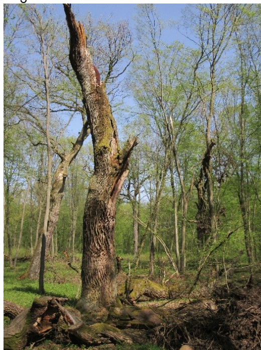
Figuur 6 Aftakelende woudreus is B&B voor insecten (Wiel Poelmans)

Ook bij de realisatie van bos buiten het NNB, in combinatie met economische functies, zal altijd een integrale afweging rondom ruimtegebruik en mogelijke externe werking worden gemaakt. Indien bovenstaande aanpak leidt tot herbegrenzing van het NNB zal de procedure van het Natuurbeheerplan via PS (binnen kaders uitgevoerd door GS) en van de interim Omgevingsverordening worden gevolgd en deze procedure kent een integrale beoordeling en afweging.