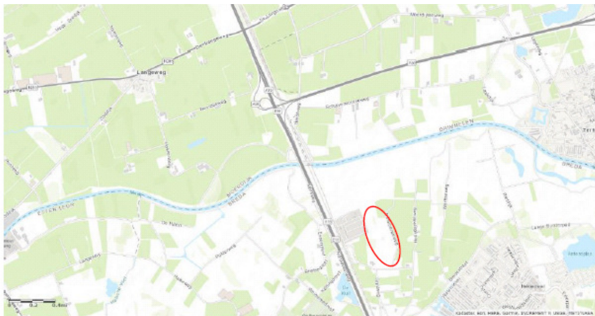
Figuur 1 - Situering locatie Windpark Nieuwveer

Windpark Nieuwveer ligt ten noorden van Breda en ten zuiden van de rivier de Mark, met windturbines ten oosten van de A16 en de waterzuivering Nieuwmeer. Het windpark ligt op 2,3 km ten westen van de kern van Terheijden, op 3,5 km ten zuidoosten van de kern van Langeweg en op 1 km ten noorden van Breda.