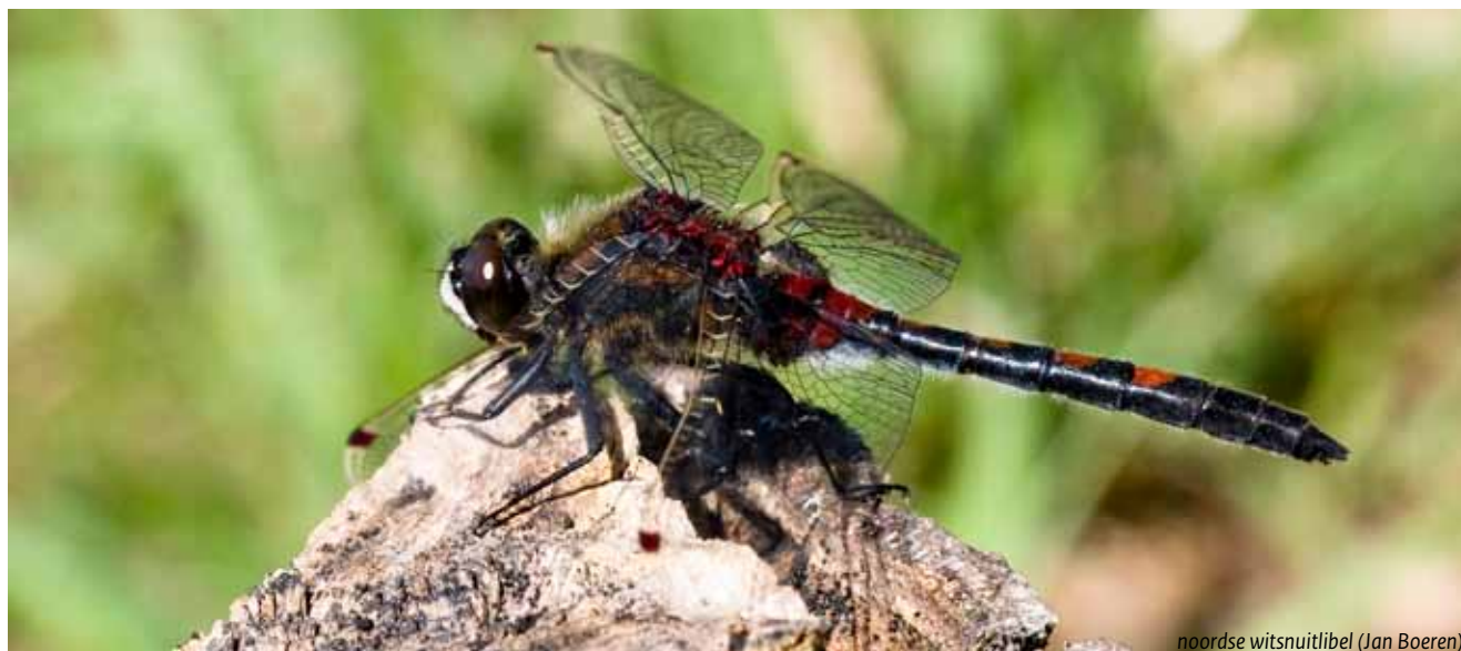
noordse witsnuitlibel (Jan Boeren)

Een relatief kleine groep, veelal jongeren, zoekt juist de uitdaging en gebruikt het landelijk gebied en de natuurgebieden als decor voor hun activiteiten. Te denken valt aan GPS-tochten (ook 's nachts), groepsactiviteiten als solextochten, outdoor-activiteiten en Peelsafari's (volgens de VVV een 'Buggytocht door de Peel met BBQ en drankjes').