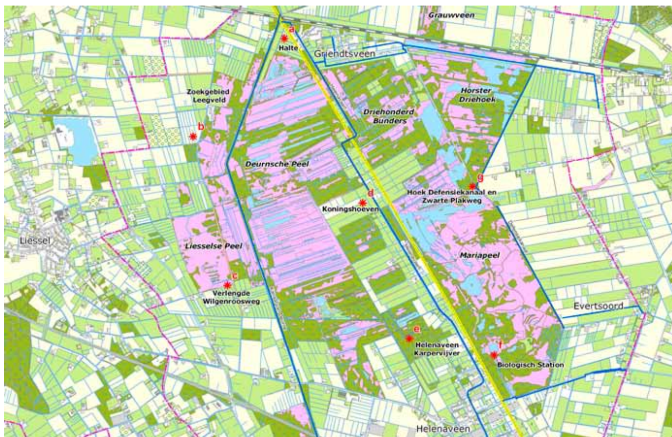
Overzichtskartaal Peeltroeven Deurnsche- en Mariapeel