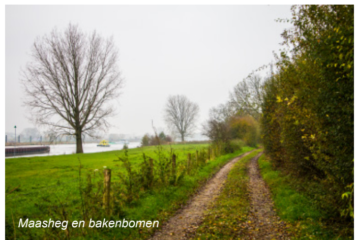
Maasheg en bakenbomen