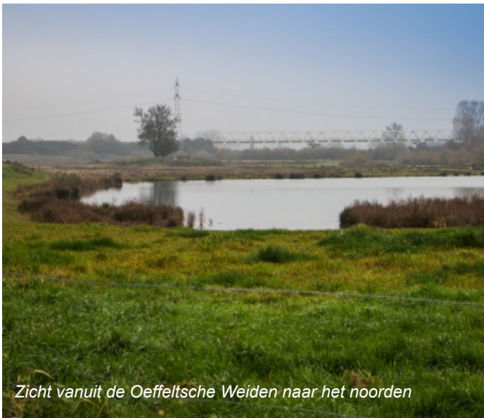
Zicht vanuit de Oeffeltsche Weiden naar het noorden