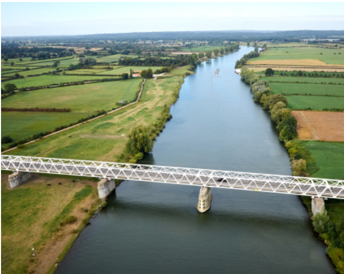
Luchtfoto 2016

Deze ‘flessenhalsproblematiek’, de cultuurhistorie van het Maasheggengebied en het voormalig ‘Duits-lijntje’ vragen om een oplossing van regio-partijen én bewoners.