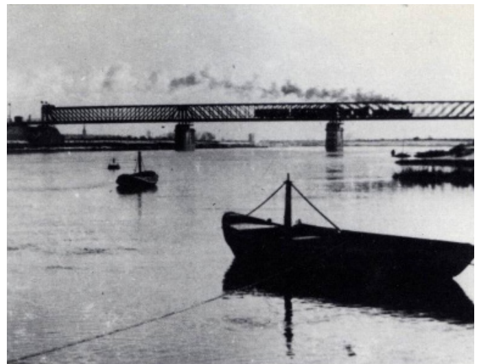
Maasbrug als onderdeel van het Duits lijntje in 1939

De zogenoemde (MIRT)-Verkenningfase duurt nog tot en met 2018 (MIRT staat voor meerjarenprogramma infrastructuur ruimte en transport). Hierin zoeken de provincie Noord-Brabant en samenwerkende partijen naar een goed passende oplossing voor de 'flessenhalsproblematiek' (voorkeursvariant). Deze fase gaat over in de zogenaamde Planstudiefase waarin de voorkeursvariant verder wordt uitgewerkt voor uitvoering. Het project moet conform de afspraken met de Minister zijn afgerond in 2028.