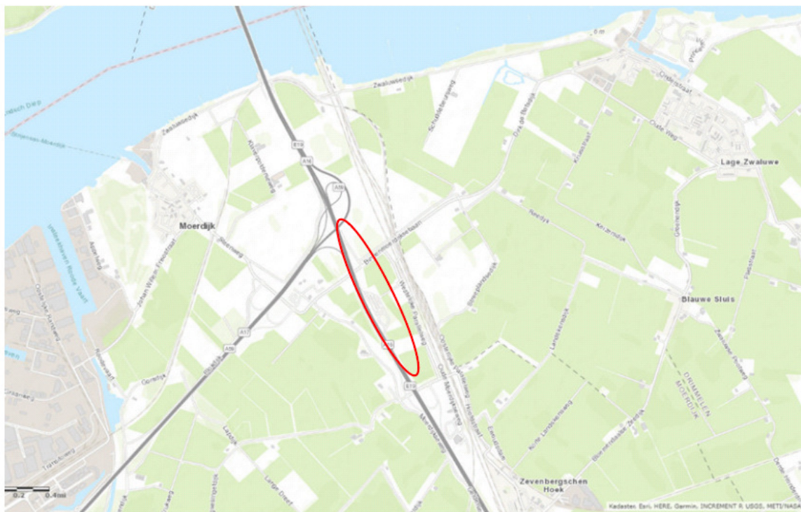
Figuur 1- Situering locatie Windpark RWS

Windpark RWS ligt tussen de Rijksweg A16 en het spoor, ten zuiden van het verkeersknooppunt Klaverpolder. Het ligt op 1,4 km afstand van de kern Moerdijk, op 3 km ten westen van Lage Zwaluwe en op 1,4 km ten noorden van Zevenbergschen Hoek.