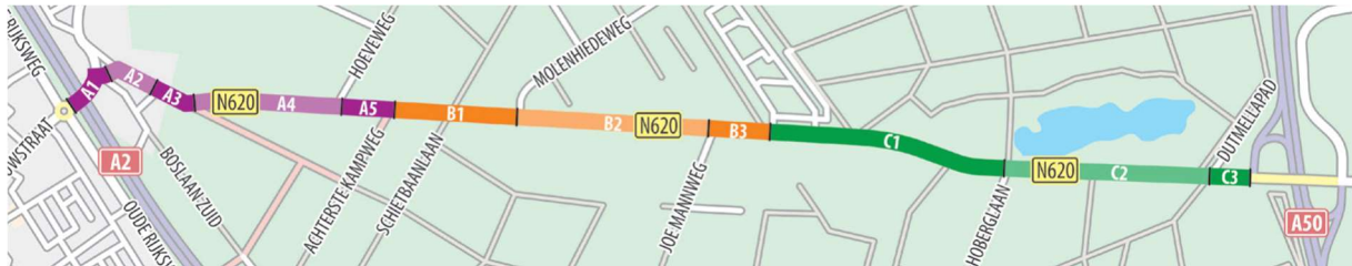
Afbeelding 1 De werkzaamheden in de verschillende subfases

De werkzaamheden aan de Sonseweg starten op 29 april 2024 en we verwachten dat onze werkzaamheden gereed zijn op 30 augustus 2024. We voeren de werkzaamheden niet in één keer uit maar in verschillende fases zoals u kunt zien in afbeelding 1.