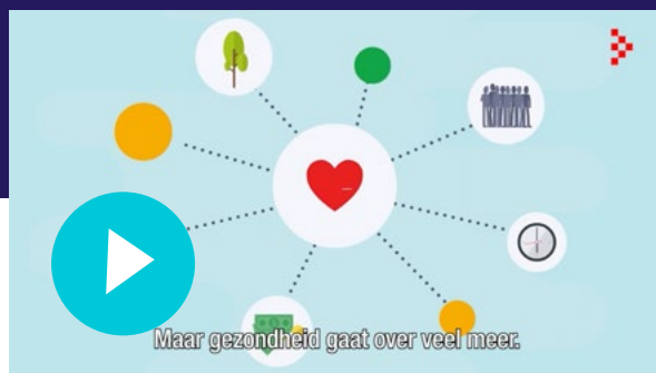
Figuur 1.1: Online animatie over de ambitie van drie gezonde levensjaren erbij in 2030

Om de video te bekijken klik je op de afspeel button