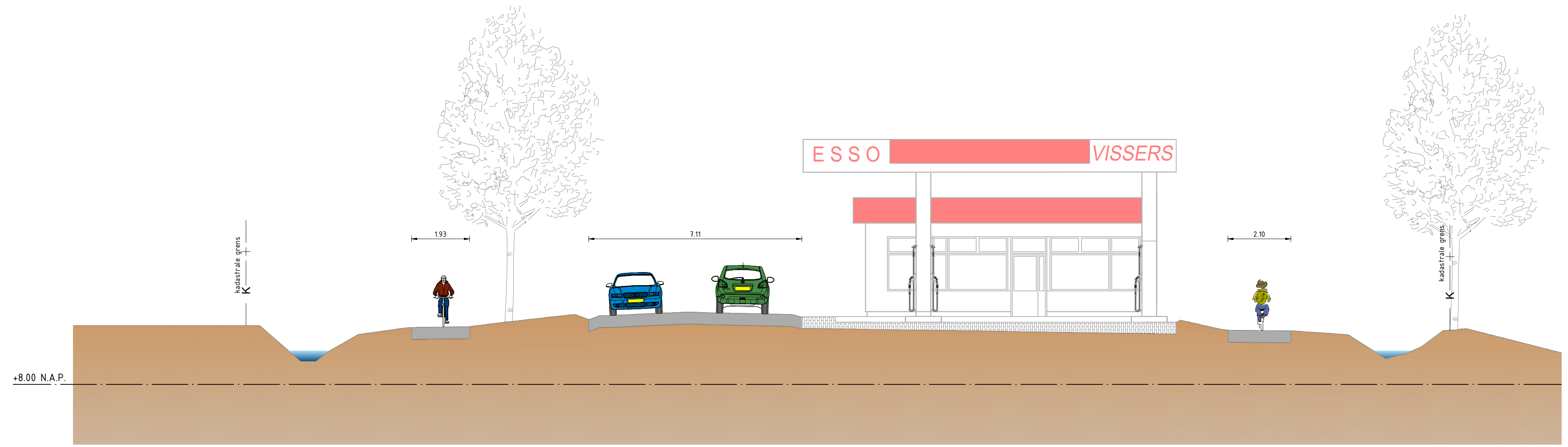
Dwarsprofiel 5.425 Bestaande situatie schaal 1:100