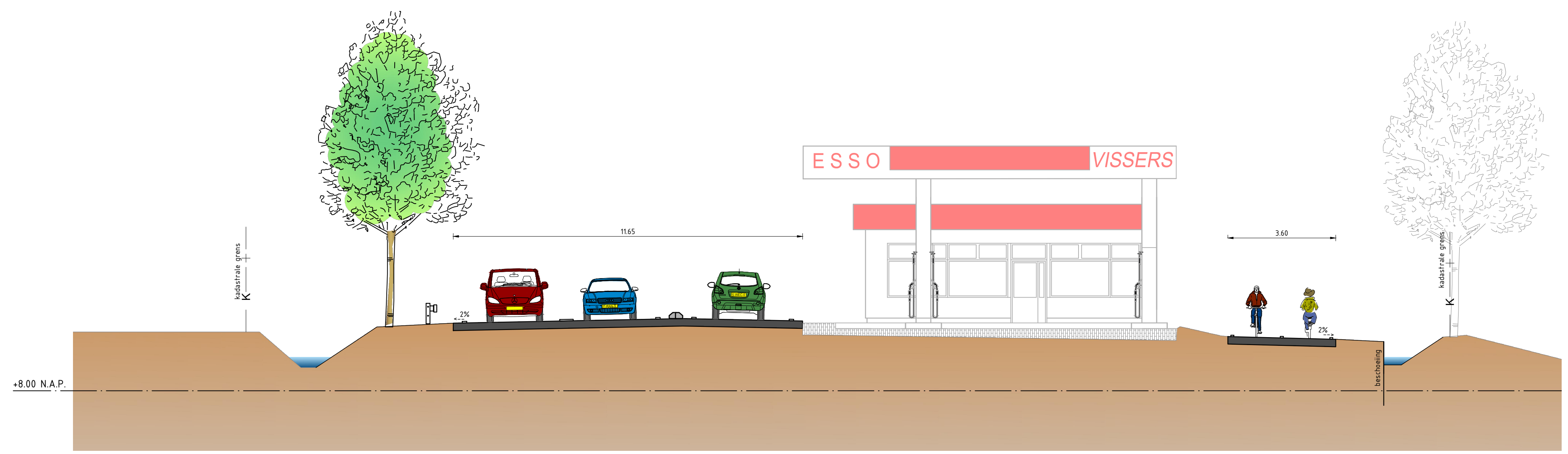
Dwarsprofiel 5.425 Nieuwe situatie schaal 1:100